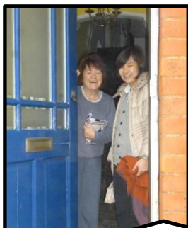
ホームステイ先到着