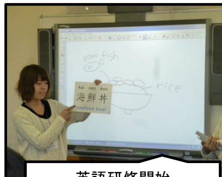
英語研修開始 (模擬授業)